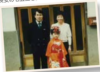
長女の七五三を祝い自宅にて(昭和63年)