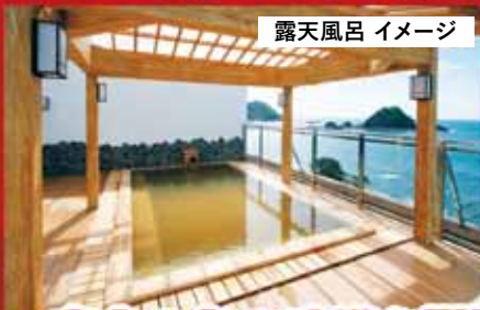
露天風呂 イメージ