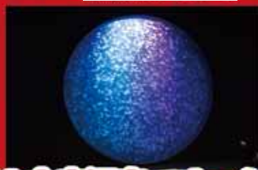
加茂水族館 イメージ