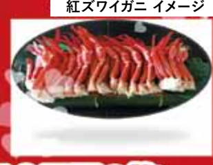
紅ズワイガニ イメージ