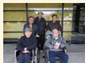
平泉文化遺産センターで記念撮影