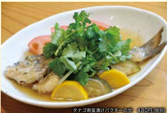
タナゴ南蛮漬けパクチーのせ 480円（税別）