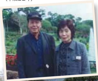
花き部会の沖縄旅行にて (平成22年)