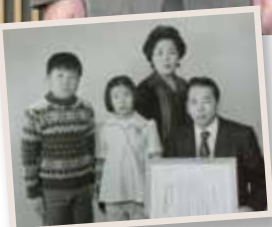
勤続20年表彰受賞 (昭和51年)