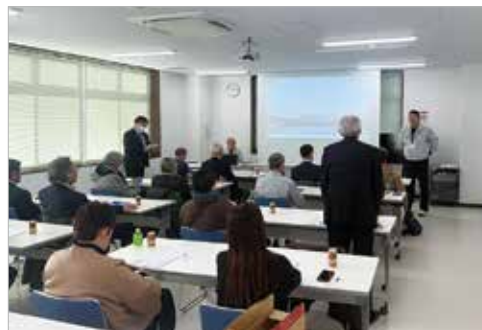
GAPについて質問する農業委員会関係者

雫石町農業委員会が令和7年12月22日、JA米集出荷センター輝を視察しました。JAブランド米部会のアジア版農業生産工程管理(ASIAGAP)の団体認証の取り組みについて、始めた経過やその効果、今後の戦略などを説明しました。また、倉庫施設内の見学を行い、倉庫に入る米の量や機械の機能などを説明しました。