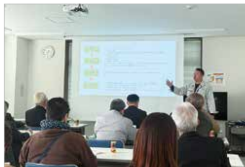
GAPの取り組みについて説明するJA職員

JAいわて平泉では、GAPを通じて持続可能な農業の推進や、安全・安心で信頼される産地形成を目標に「いわて平泉米」の供給に取り組んでまいります。