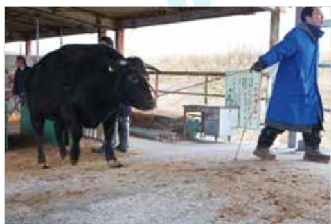
牛をトラックへ運び込む生産者