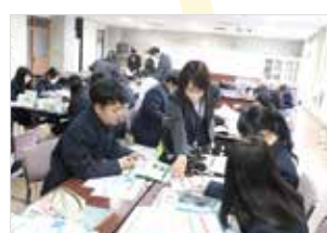
JA職員の指導を受け、お金や経営を学ぶ生徒