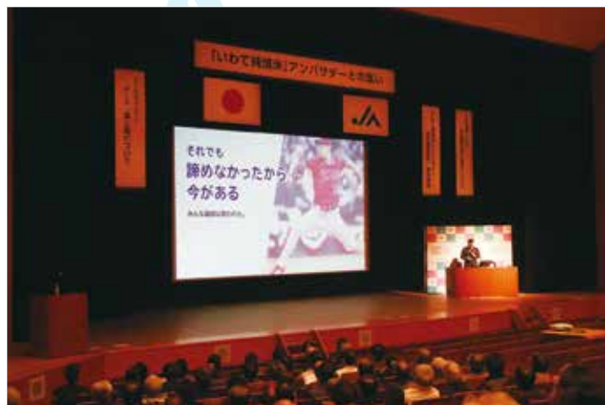
県内各地から約400人が参加しました

盛岡市中央卸売市場の初市式と初競りが開かれ、管内の農畜産物を乗せた宝船が12万円で競り落とされ、幸先の良いスタートとなりました。宝船は、管内で生産された旬のイチゴやリンゴなどを乗せ、「いわて南牛」の精肉と「金色の風」の精米を添えました。