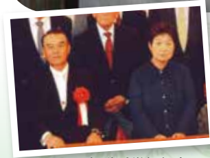
叙勲受賞祝賀会にて (令和5年6月)