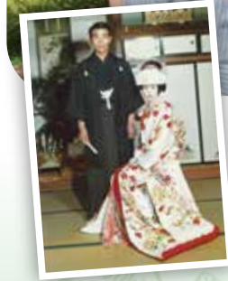
結婚式にて(昭和46年11月)