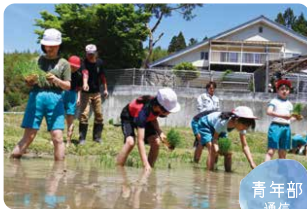
青年部員の指導で田植えをする児童

JA一関青年部真滝支部は5月10日、滝沢小学校（一関）の田植え体験の指導を行いました。5年生18人は、4月に種まきした「ひとめぼれ」の苗を、3ヶの水田に手作業で丁寧に植えました。児童たちは泥の感触に歓声を上げながら、田植えを楽しみました。今後は、稲の成長や水田の周辺環境の観察会を開き、秋には手刈りで稲刈りを行う予定です。