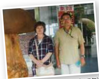
2人で旅行した久慈市で(平成27年)

お二人の趣味はドライブ。 「いつか宿泊しながらいろいろな場所に行ってみたい」と笑顔を見せます。