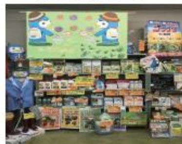
平泉営農経済センター