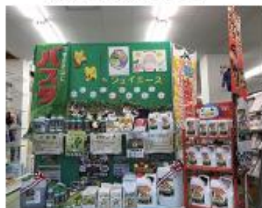
千厩営農経済センター