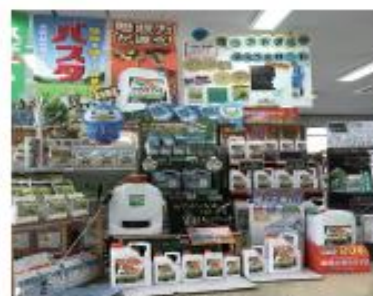
花泉営農経済センター