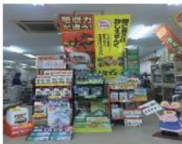
藤沢営農経済センター

岩手県地区表彰 最優秀賞 千厩営農経済センター 優秀賞 大東営農経済センター ラウンドアップノズルULV5賞 花泉営農経済センター スタークル賞 平泉営農経済センター ゴウケツ賞 花泉営農経済センター