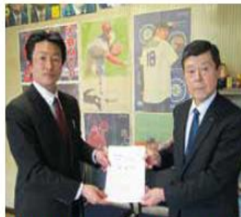
3月9日 小沢一郎衆議院議員奥州市事務所へ