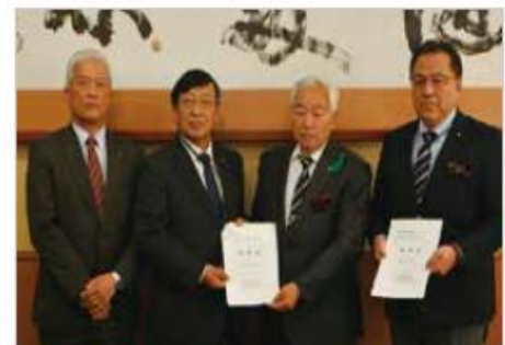
3月25日 平泉町長、町議会へ