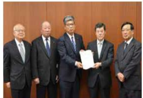
3月15日 一関市議会へ