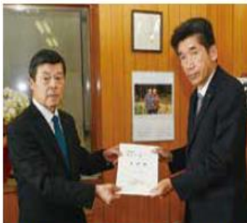
3月9日 藤原崇衆議院議員一関事務所へ