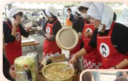
女性部特製はっと 仕込みはバッチリ!