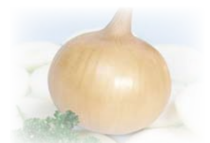
監修：(株) 渡辺採種場

8月号で定植までの栽培を掲載しましたが、今回は、定植後の管理から収穫・貯蔵までを紹介します。