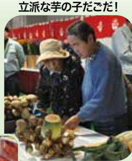
立派な芋の子だこだ!