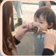
いわて南牛の 串焼きに夢中〜