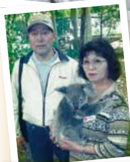
平成 18 年オーストラリアにて