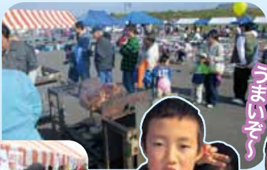
いわて南牛 うまごぞ〜