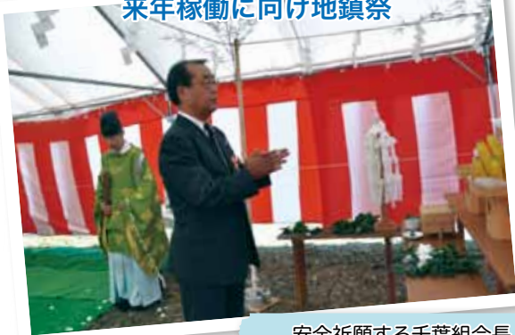
安全祈願する千葉組合長

JAは初となるサービス付き高齢者向け住宅とデイサービスの併設型施設を来年稼働させます。10月10日には建設予定地の一関市真柴で施設新築工事の地鎮祭を行いました。施設は総敷地面積が6298㎡、サービス付き高齢者向け住宅が25室、デイサービスは1日あたり30人が利用可能な施設で、どちらも2階建て。来年3月にデイサービスを、翌4月にサービス付き高齢者向け住宅をそれぞれ稼働させます。