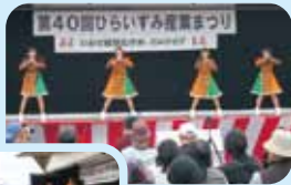
いわて純情むすめミニライブ!