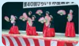
農家組合芸能大会で 日頃の練習の 成果を披露