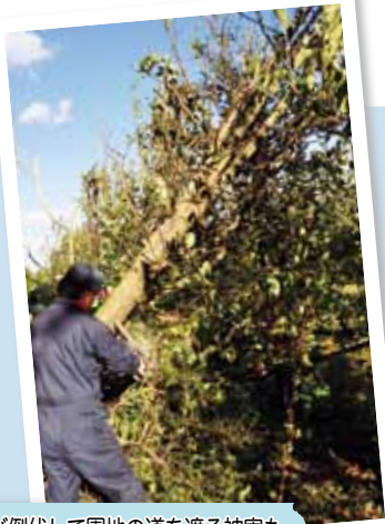
防風林が倒伏して圃地の道を遮る被害も