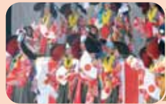
鶏舞を披露した 涌津小学校のみなさん、 上手くできたかな?