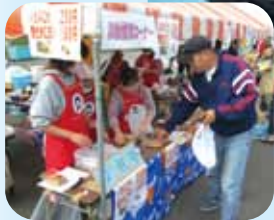
JA女性部の特製グルメ