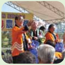
紅白もちまきで 幸福祈願!