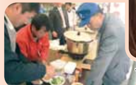
やっぱり青年部のもつ煮だよ!