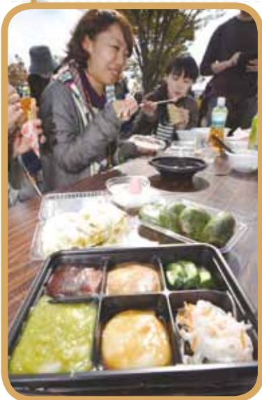
▲ 家族連れ客などが多数。餅グルメを満喫

グランプリ以下のメニューは以下のとおりです▽2位＝「川崎炒め納豆もち春巻」(一関商工会議所青年部川崎支部)▽3位＝「大東やまあいお雑煮」(京津畑やまあい工房)▽4位＝「ゴールデンブーバー」(平泉農家茶屋)▽5位＝「ピザ揚げ餅」(菜花堂)