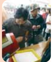
大抽選会の一等は いわて南牛!