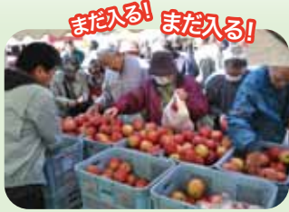
まだ入る! まだ入る!