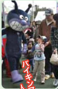
ハイキングも 人気です!