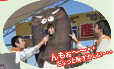
んもお〜 ちよっと恥ずかしい〜