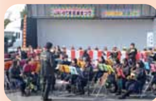
花泉中学校の吹奏楽部は あまちゃんのテーマを演奏