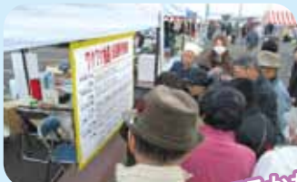
ワクワク抽選会! 当たってるかな??