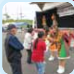
クイズで素敵な プレゼントをゲット!