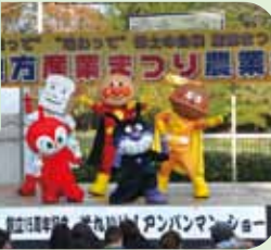
JAいわて南 創立15周年記念の それいけ! アンパンマンショー!