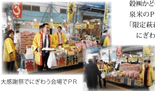
大感謝祭でにぎわう会場でPR