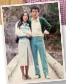
狛鼻溪にて (昭和52年)